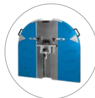
Carter de lame léger et solide