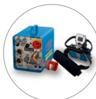
Commande compacte et légère, radio-commande pratique avec écran

La WSE1621 a été développée pour les travaux quotidiens des chantiers de construction. Par ses fonctions digitales et sa légèreté, ce nouveau système bouleverse les standards du sciage mural. Le montage et le démontage se font en un instant