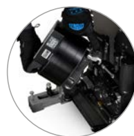
Fixation du moteur sans outil